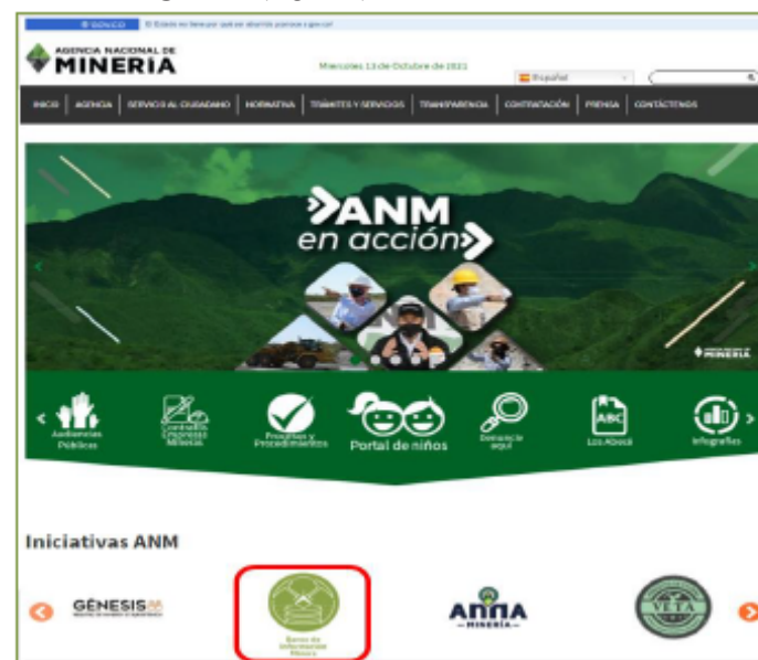
Figura 1. Botón de ingreso al BIM desde el sitio web de la ANM

Al Portal de Autoatención de carga de información ( Portal de Carga ), se puede acceder desde el portal de la Agencia Nacional de Minería ( https://www.anm.gov.co/ ), en el banner de “ Iniciativas ANM ” (Figura 1) o ingresando al sitio web del BIM ubicado en el Portal del Servicio Geológico Colombiano ( https://www.sgc.gov.co/ ), en la pestaña “ Programas de investigación ” (Figura 2).