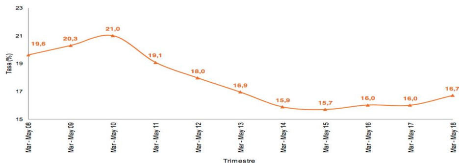
Gráfica 2. Tasa de desempleo de la población joven (14 a 28 años) Total nacional Trimestre móvil marzo - mayo