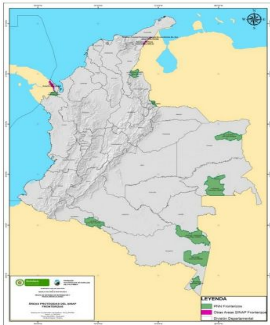
Mapa 2. Áreas protegidas del Sistema Nacional de Áreas Protegidas Fronterizas

No obstante sus potencialidades, su diversidad cultural y étnica, y su favorable localización para el desarrollo económico, los departamentos y municipios fronterizos del