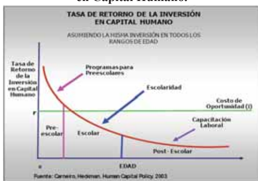
Tabla 1. Tasa de Retorno de la inversión en Capital Humano.

Otra política pública vinculada al derecho a la asistencia alimentaria está vinculada también a la Política de Cumplimiento de Metas y Estrategias de Colombia para el logro de los Objetivos de Desarrollo del Milenio - 2015, consignado en el Conpes Social número 91 de 2005. El primer objetivo es precisamente erradicar la pobreza extrema y el hambre. Las metas para erradicar el hambre, fueron: