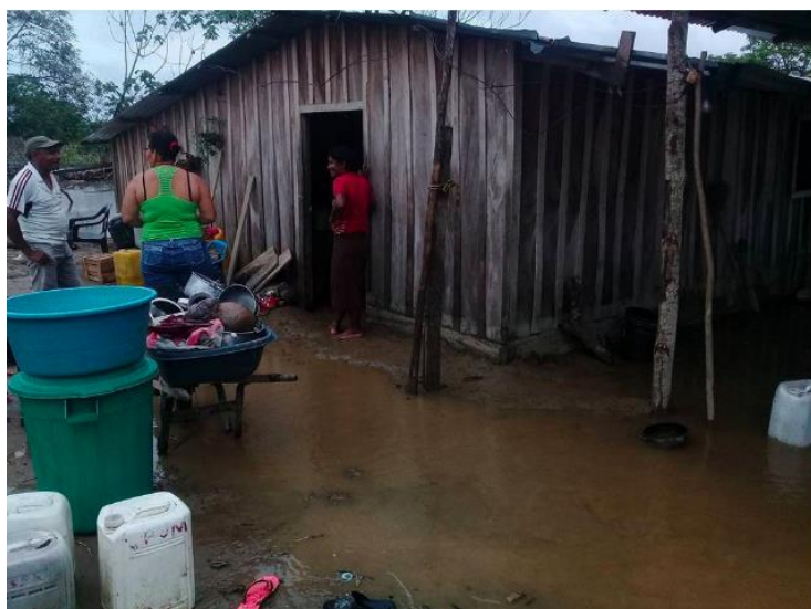
Municipio de Achí, Bolívar, en la subregión de La Mojana

En el municipio de Achí, Bolívar en el 2017, la zona rural fue afectada en un 90 por ciento, y alrededor de 15.000 hectáreas tuvieron pérdida total de cultivos y perjuicios a la ganadera, debido a las inundaciones.